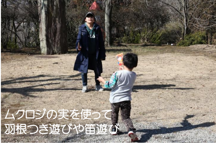
ムクロジの実を使って 羽根つき遊びや笛遊び