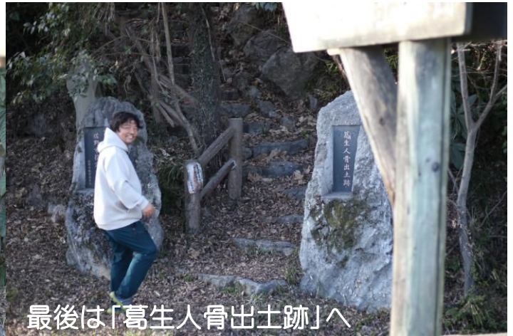
最後は「葛生人骨出土跡」へ