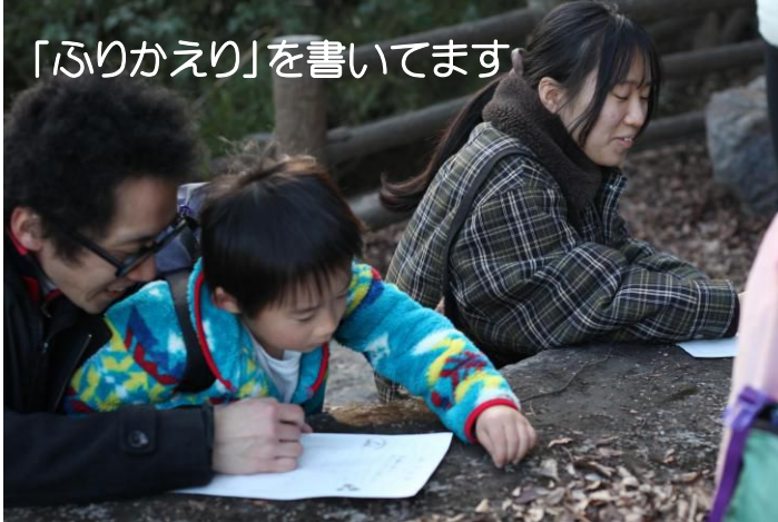
「ふりかえり」を書いています