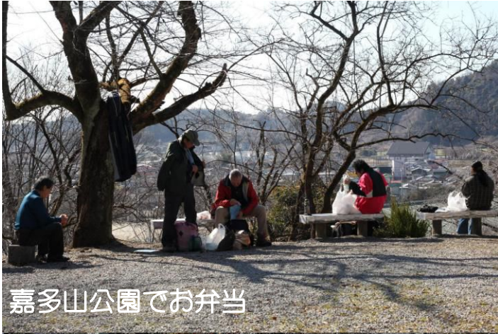
嘉多山公園でお弁当